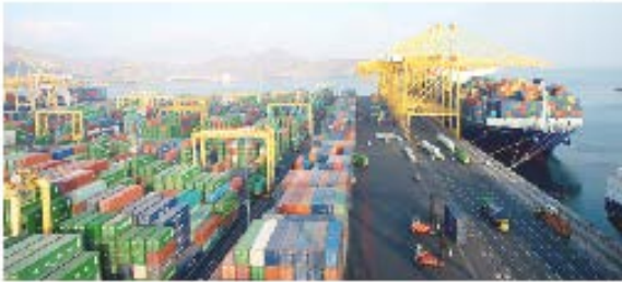
الهدل للمشاريع التطويرية: سلاسل توريد مرنة