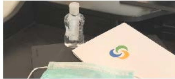
الصحة والسلامة وبناء القدرات