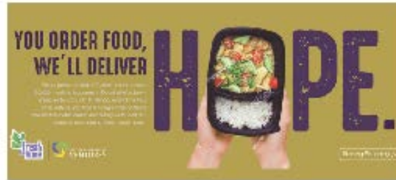
الهدل للمشاريع الناشئة: تمويل الشركات الناشئة ودعم المجتمع