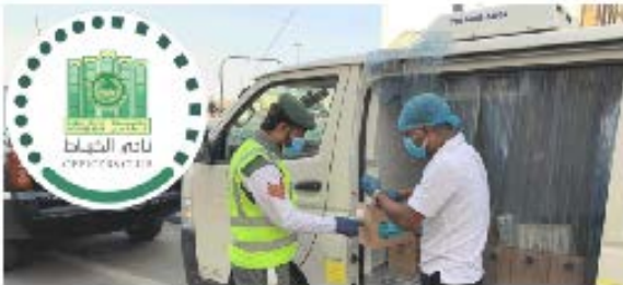
الهدل للمشاريع الابتكارية: ممتنون لجهود أبطالنا