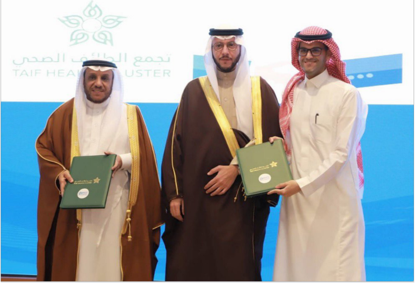
منزل لخدمات الرعاية الصحية لدى مراسم توقيع اتفاقية التعاون مع تجمع الطائف الصحي

وتسعى منزل في إطار هذا التعاون إلى خدمة مجتمع الطائف بتحسين صحة السكان ورفع مستوى رفاهم بصورة مستدامة.