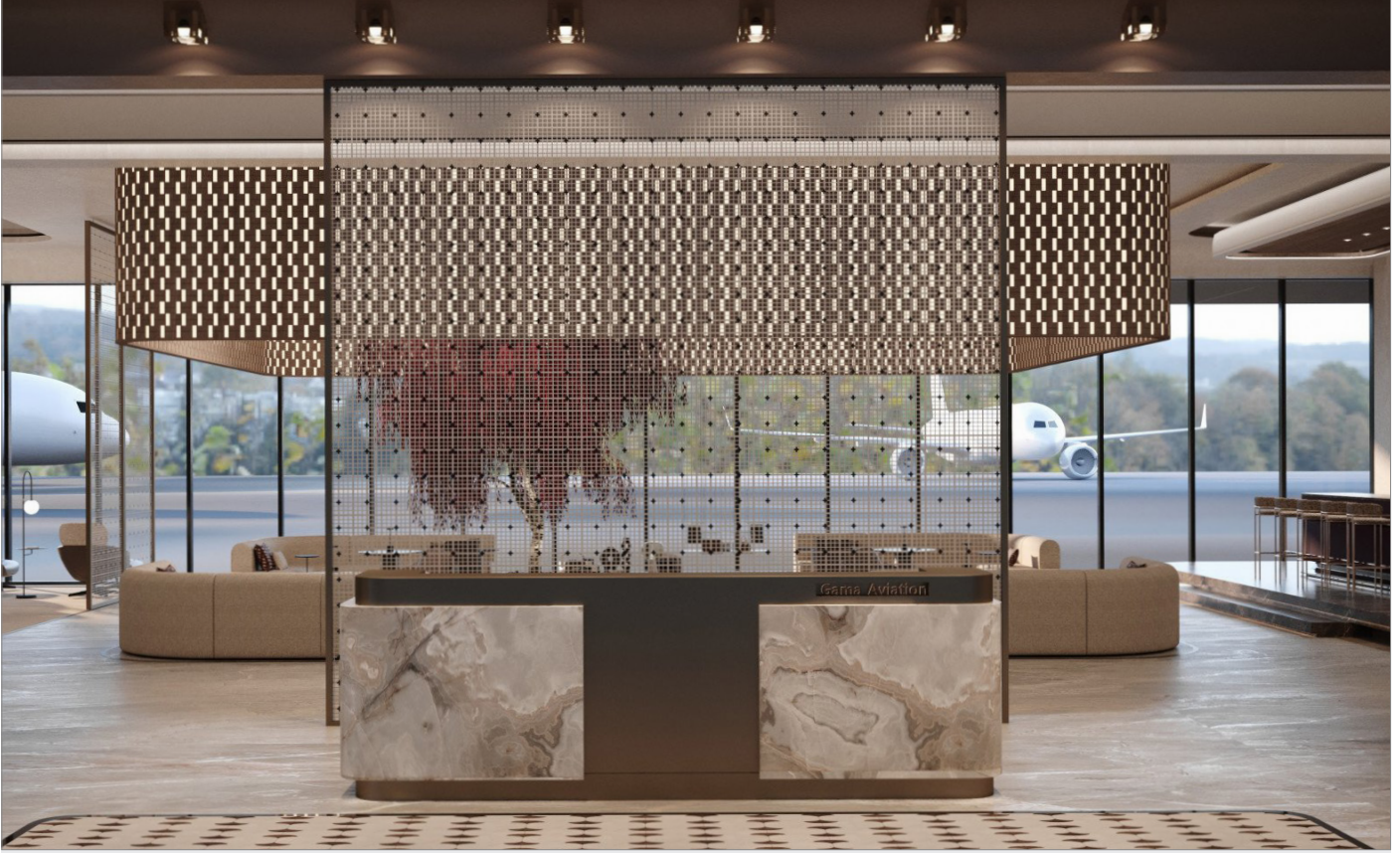
مركز طيران الأعمال في الشارقة

وسيحتموي قسم عمليات القاعدة الثابتة مساحةً لمكاتب متاحة للاستئجار لفترات قصيرة وطويلة تناسب فرق عمليات شركات الطيران الإقليمية الباحثة عن قاعدة غير مكلفة في مطار دولي يقدم خدمات طيران الأعمال.