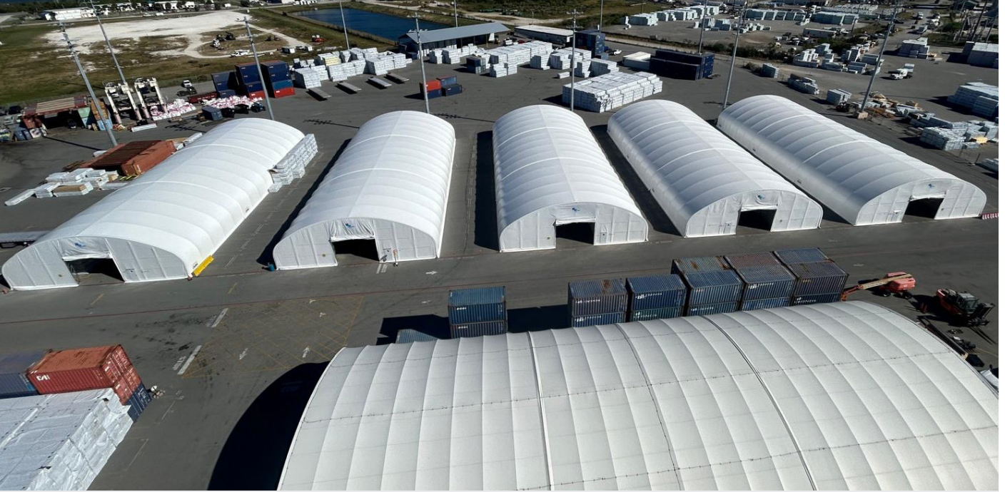
لقطة جوية للمستودعات الجديدة في محطة كانافيرال للشحن

رئيسية في مهمة غلفتينر الأمريكية الملتزمة بتقديم أفضل الخدمات العالمية، وترسخ المنشآت الجديدة قدرتنا على إدارة الشحنات المتزايدة، بما فيها الشحنات المتأثرة بالجو، مع الحفاظ على خدماتنا المتميزة ومعايير الجودة العالمية التي نشتهر بها.»